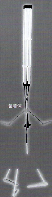
ライナー用 (IS-110ST-B) ※床にキズがつきにくい