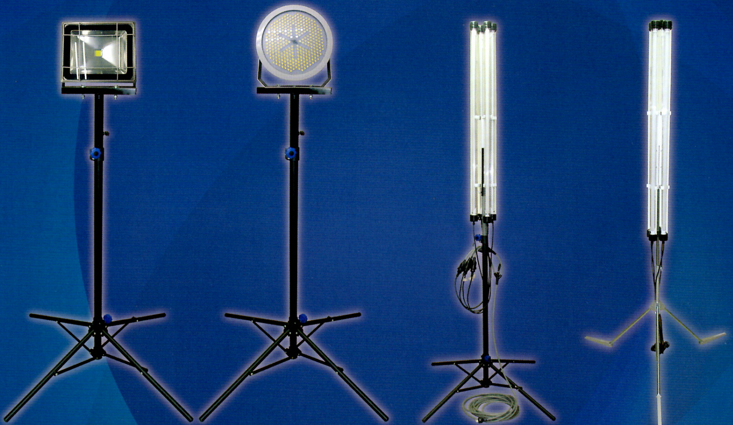
IS-440 ST 4脚 CS-50 取り付けイメージ